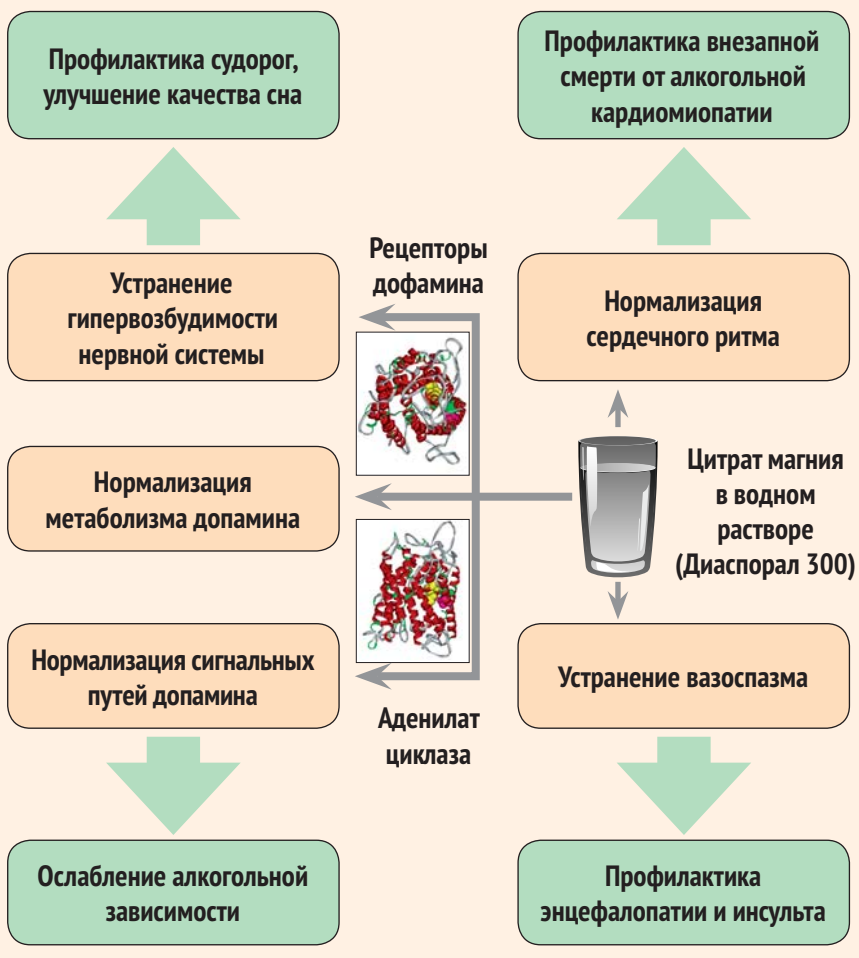
Рисунок 3. Возможности профилактики алкоголь-индуцированной патологии посредством водного раствора цитрата магния

Очевидно, что «разогрев» таблетки, спрессованной из безводного цитрата магния, может приводить к нежелательным органолептическим последствиям. Во-первых, ощущение «разогрева таблетки» во рту при попадании слюны на безводный цитрат магния – довольно неприятное ощущение. Во-вторых, попадание таблетки из безводного цитрата магния внутрь ЖКТ может приводить к ожогам пищевода и желудка или, по крайней мере, к ощущению тошноты (которое связано вовсе не с самим цитратом магния, а именно с выделе-