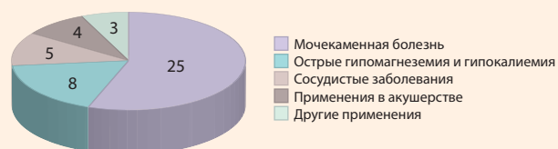
Рисунок 2. Клинические исследования по терапевтическим и профилактическим применениям цитрата магния

В исследовании 22 добровольцев, получавших гидролортиазид в количестве 50 мг/сут, 10 человек одновременно получали смесь цитратов магния и калия (42 мг К+/сут, 42 мг Mg2+/сут), а 12 человек – только хлорид калия (42 мг К+/сут). Помимо компенсации дефицита калия, композиции цитратов К и Mg способствовали ощелачиванию мочи (т. е. повышению pH мочи), снижению уровней мочевой кислоты и снижению насыщения оксалата кальция. Хлорид калия приводил только к увеличению содержания калия в моче и не влиял на уровни магния [32, 33].